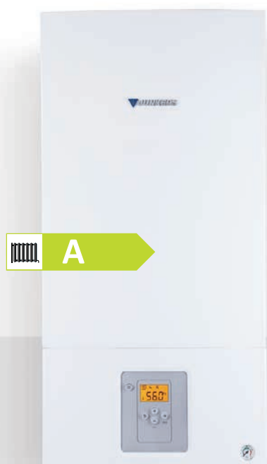
CerapurCompact Plynový kondenzačný kotol

Vyobrazená trieda energetickej účinnosti udáva energetickú účinnosť produktu ZSB 14-1 DE, modelu produktovej rady CerapurCompact. Trieda energetickej účinnosti iných produktov z tejto produktovej rady sa môže líšiť.