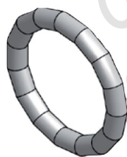
Těsnicí O-kroužek LBP