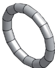
Těsnicí O-kroužek LBP