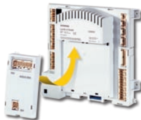
LMU64 + AGU 2500