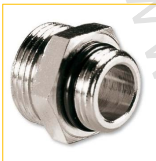
IVAR.AC 4604 N