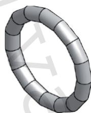
Těsnicí O-kroužek LBP