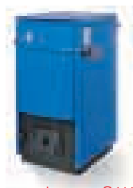
Logano S111 s reguláciou spaľovania

Napriek malej inštalačnej ploche má veľký, zhora prístupný plniaci priestor, ktorý má podľa výkonu rozmery na polená až do pol metrovej dĺžky. Integrovaný natriasací rošt uľahčuje čistenie. Logano S111 dodrží čo sľubuje: v zime príjemné teplo.