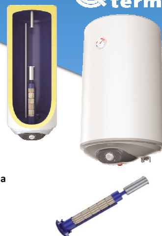
TREND 50 - 120 L